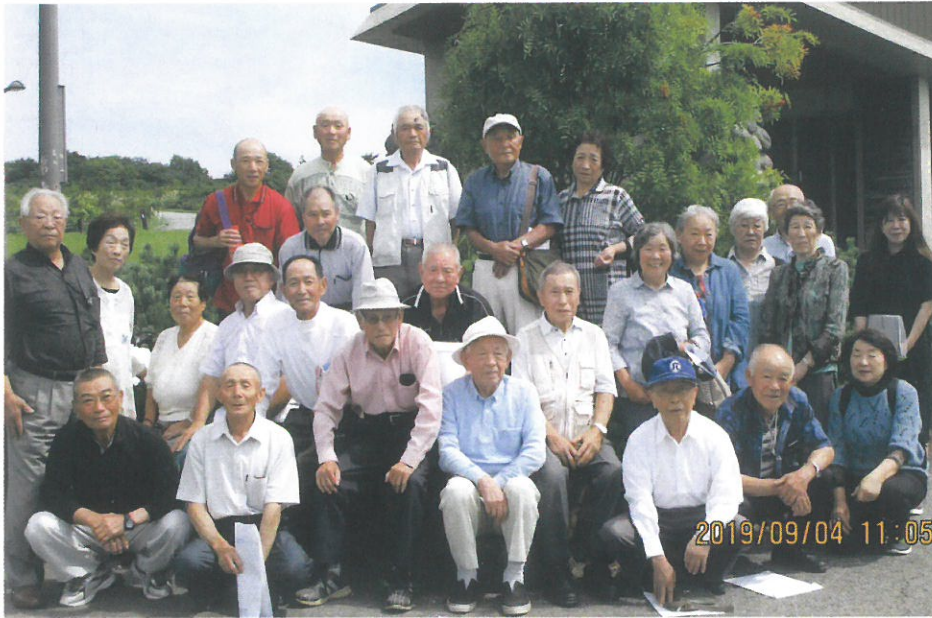
▶到着してすぐに記念撮影 久々、山の空気を満喫しました！

研修では、8月22日安全就業推進員研修会の内容を伝達研修しました。安全就業のためには、自らの健康づくりが重要であり、健康づくりには、まずは転倒を予防することが第一になることを学びました。転倒予防には、外的要因である転倒しない環境づくりを行うこと。内的要因では、筋トレ、有酸素運動(歩く)、バランス運動を行い、疲れにくい体、動きやすい体を作ることが大事ということです。