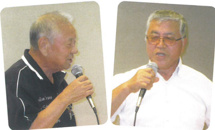
▲シルバーのど自慢大会 十八番の曲が次々披露されました！

研修の後は、お風呂、懇親としてお待ちかねのカラオケタイムと進み、帰りのバス出発が心配になる程、十八番の歌は続きました。最後は、お楽しみ抽選会となり、当選者には鳥海山の特産品がプレゼントされました。夏の疲れを癒し、秋の作業に向けて、大いに英気を養いました。